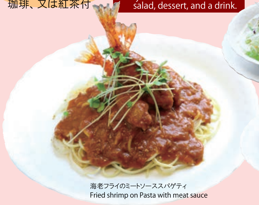
海老フライのミートソーススパゲティ Fried shrimp on Pasta with meat sauce

Every dish comes with salad, dessert, and a drink.